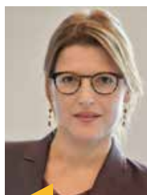
éditorial Ségolène Benhamou

S ommes-nous prêts à vivre la révolution des pratiques en santé que l'intelligence artificielle nous réserve d'ici une échéance de 5 ans ? La feuille de route gouvernementale proposée par le Pr Villani est ambitieuse et prévoit de consacrer 150 millions d'euros à la seule santé et amélioration des diagnostics médicaux grâce à l'IA. Le train est déjà grandement en route et il s'agit pour le moins de monter dedans, pour le mieux de participer au co-pilotage.