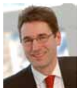
Au sein du groupe, le mot d'ordre est l'amélioration continue de la qualité, et certaines de nos cliniques ont atteint le niveau d'excellence d'établissements universitaires.

« L e groupe privé Asklepios a une capacité de 26 600 lits pour un total d'environ 45 000 employés, ce qui en fait avec 140 établissements le deuxième plus grand groupe en Allemagne. Hambourg en est un pôle important avec sept grandes cliniques. Toutes les disciplines médicales ainsi que la psychiatrie sont représentées. Tous nos médecins, à quelques exceptions près, sont salariés. La stratégie de notre groupe repose sur les principes de la décentralisation et de la mutualisation. Cela signifie que les stratégies et les recommandations de traitements de toutes