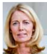
Chacun a son mot à dire dans toutes les décisions prises au sein de la clinique.

« L a Clinique Sankt Görän, du groupe Capio, est située en plein cœur de Stockholm et fait partie des plus grands établissements de la capitale suédoise. Elle dispose d'une capacité d'accueil de 310 lits, accueille 220 000 patients par an, dont 80 000 en urgence (unique service d'urgences privé en Suède). La clinique emploie 250 médecins, tous salariés de l'établissement, comme il est de règle en Suède. Les décisions sont prises de façon col-