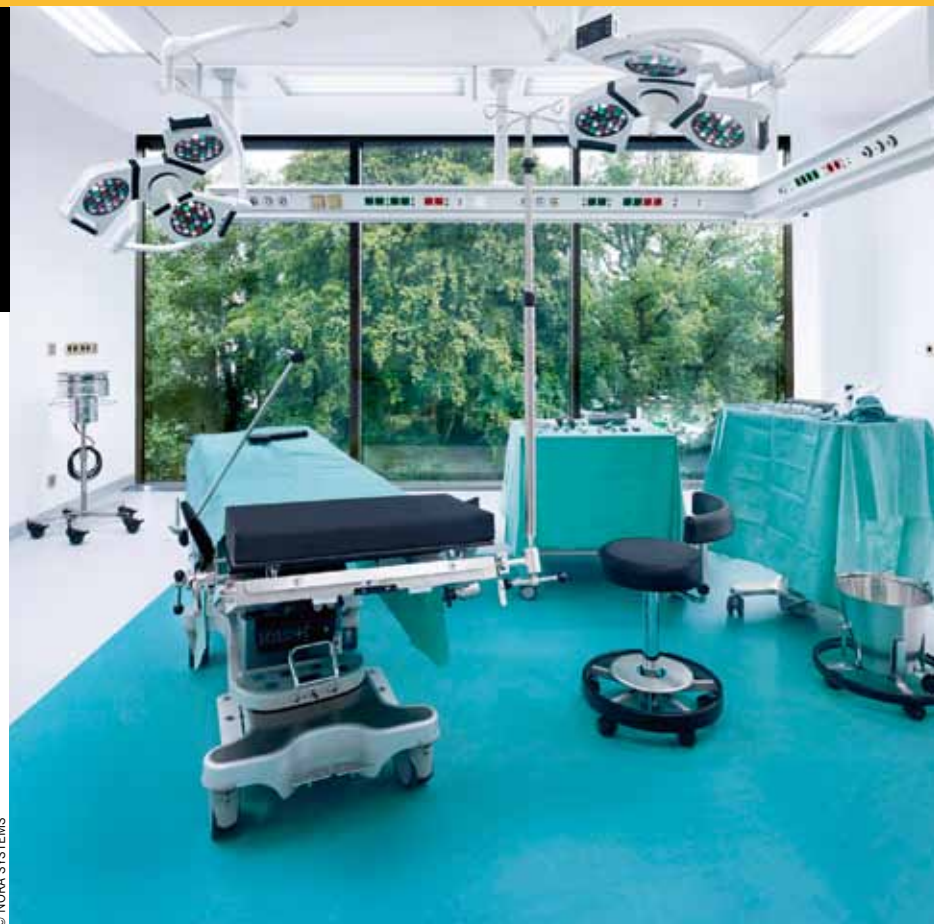
Vue du bloc opératoire de l'institut Fraunhofer de Duisbourg (Allemagne).