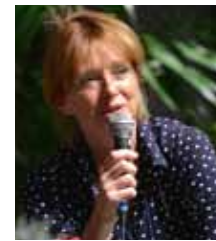
Demain la principale modification va arriver avec la génétique.

Le statut du médecin va lui aussi changer. D'autres métiers vont venir interférer. Les jeunes médecins ont encore une formation traditionnelle. Je ne suis pas certaine qu'ils aient conscience de ces changements et qu'on les y prépare. En ce moment on est confronté à de grandes discussions sur le statut libéral qu'il faut absolument défendre. Actuellement on a déjà la possibilité de salarier des médecins dans certaines situations car la loi HPST nous le permet, notamment dans les cas où on a du mal à faire tourner un hôpital sur une spécialité. Mais je pense que cela doit rester l'exception. Il faut cependant garder la relation avec les médecins libéraux, ce qui fait la spécificité de notre secteur. Si l'on allait vers un salariat des médecins, je crois que l'on perdrait notre performance.