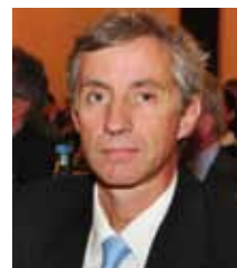
La santé à l'échelle mondiale va s'approprier de nouveaux outils.

On fera des économies sous réserve d'identifier en amont du soin les facteurs de risque et la façon de gérer ces nouvelles filières. La ligne forte de l'évolution d'aujourd'hui nous obligera à sortir du soin purement curatif pour adopter une stratégie de services. Aujourd'hui un citoyen a besoin d'un service de santé, non pas d'une succession de thérapeutes. Il faut donc qu'on se donne les moyens de faire évoluer le système préventif, d'accompagner le patient, de le surveiller, de le guider et cette réforme sera certainement la plus efficace pour réduire le recours aux soins et faire ainsi des économies.